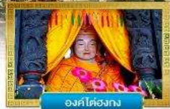
องค์ไตองกง