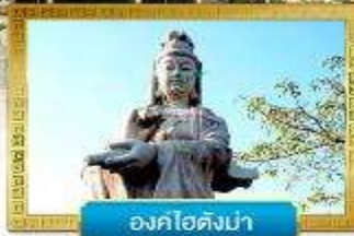
องค์ไร่ดงม้า