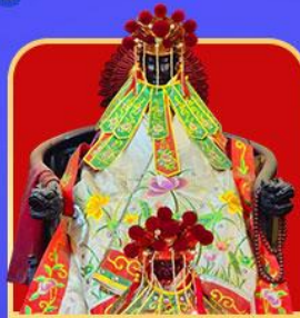
เจ้าแม่กวนอิมสองอ้า